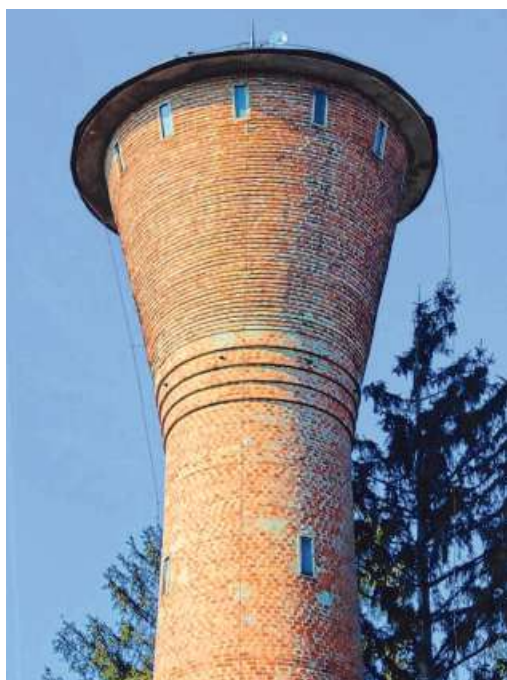
A téglabuzogány víztorony, ilyenekből húsz körül található csak az országban. Jobbra: az egykori Boldogfai Farkas-kúriából Makovecz Imre tervei szerint alakították ki a faluházat. Ez az épület is bekerült a Makovecz- emlékeket őrző kormányhatározatba

Bagod szellemiekben is adott maradandót. A reformkorban a megye adakozásra szólított fel, az egyik helyi